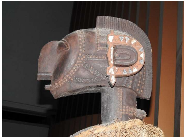
Musée des civilisations noires