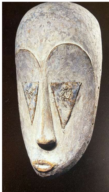
Maschera Fang, Gabon