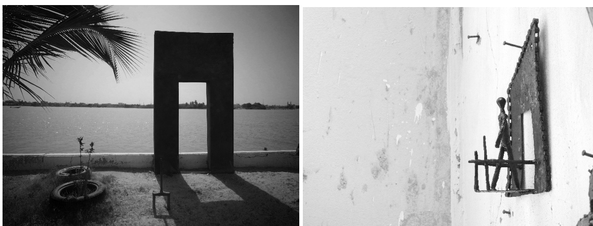
La porte d'Afrique di Fall Meissa