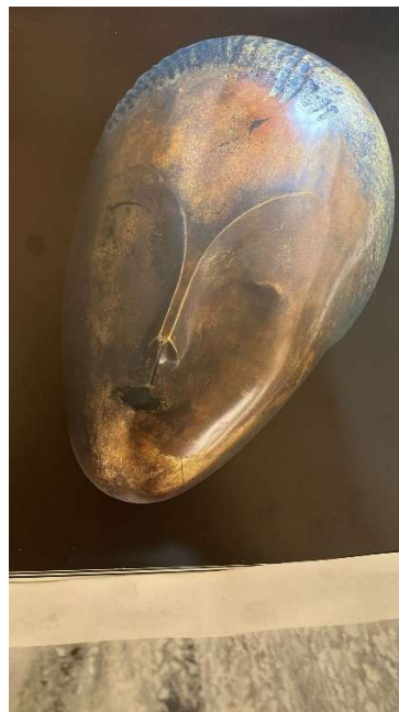
Costantin Brancusi 1913

Da Africa Capolavori di un continente, Torino 2003