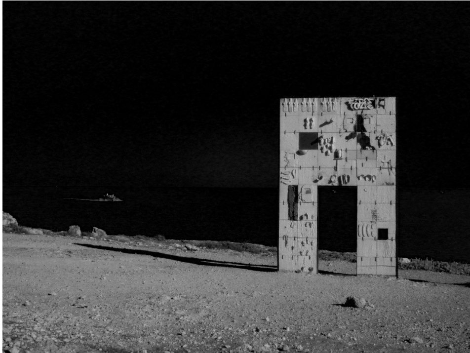
La porta d'Europa di Mimmo Paladino

L'idea di porta rimanda a giochi linguistici, associazioni e campi semantici dispiegati: soglia, limite, frontiera, confine, diversità, diseguaglianza, specificità, domesticità e estraneità fino a includere le topografie relazionali di chi è amico o nemico. È per estensione segno materiale di un limite che ci appartiene per specie e che, nella nostra incompletezza, rimette alla necessità di continui oltrepassamenti, sempre delicati e mai definitivi. In terre americane il lessico indigeno costruisce coincidenze tra “questa è la mia casa” e “io conosco”, mentre, per converso, le terre straniere e lontane descrivono lo smarrimento del non conoscere. Le porte riguardano le demarcazioni materiali del noi con il mondo animale, con quello vegetale, minerale, con il divino ma anche all'interno di quello umano. Famiglie di frontiere e moltiplicazioni di soglie poi assumono la fisionomia cruenta delle diseguaglianze che stabiliscono la linea che separa il privilegio dall'esclusione. La porta è l'istantanea della frontiera e quest'ultima detiene l'arbitrio del permettere o negare l'accesso.